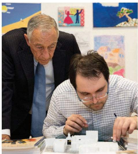
Visita do Presidente da República